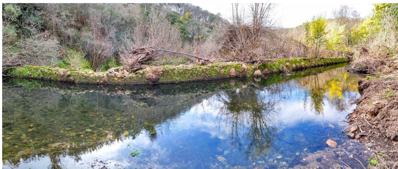
Açude no rio Alfusqueiro com remoção agendada para dia 3 de março de 2022

O projeto LIFE Águeda, coordenado pela Universidade de Évora/MARE, avança esta semana com os trabalhos de remoção de obstáculos aos movimentos piscícolas nos rios Águeda e Alfusqueiro. Estes trabalhos fazem parte de um conjunto de intervenções num total de 13 obstáculos na bacia hidrográfica do Vouga, com a finalidade de restabelecer a continuidade fluvial em cerca de 34 km. Ao todo, serão removidos total ou parcialmente 8 barreiras, sendo as restantes 5 alvo de instalação de dispositivos de transposição piscícola, vulgarmente referidos como passagens para peixes. Nos dias 3 e 4 de março serão removidos os dois açudes de maior dimensão na área de intervenção do projeto, um no rio Alfusqueiro, com cerca de 3 m de altura desde o leito do rio, e o outro no rio Águeda, com uma altura aproximada de 1 m.